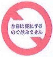
飲酒運転根絶バッジ 和歌山県